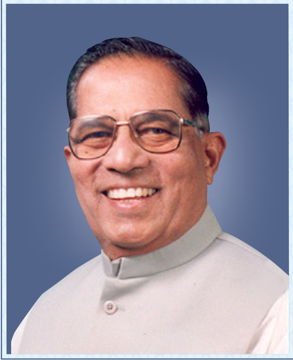
स्व. जयवंतराव भोसले (आप्पासाहेब)